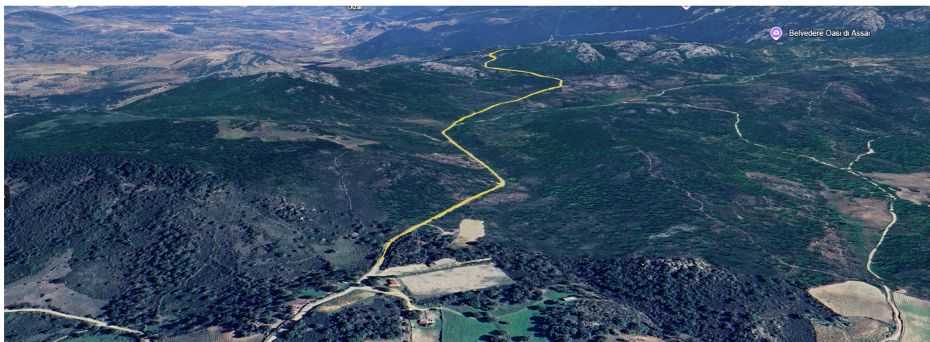
Immagine 2 - Vista 3D intervento