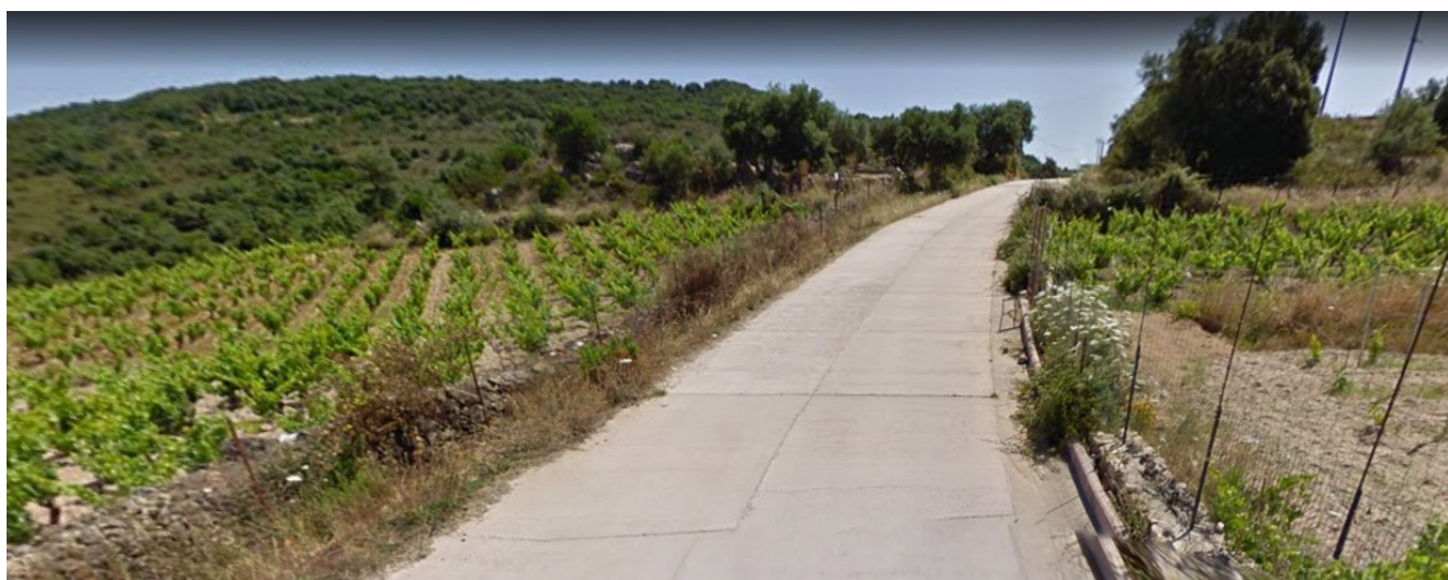
Immagine 3 - Tratto precedente già realizzato